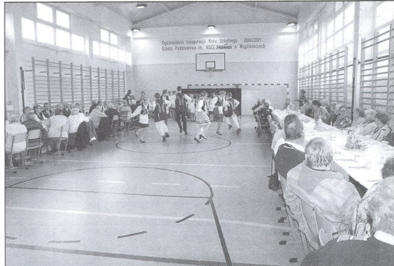
Piękną oprawę artystyczną mieli Seniorzy na spotkaniu w Wąglikowicach