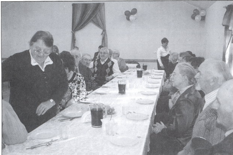
Spotkanie z Seniorami w Kaliskach Kościerskich.