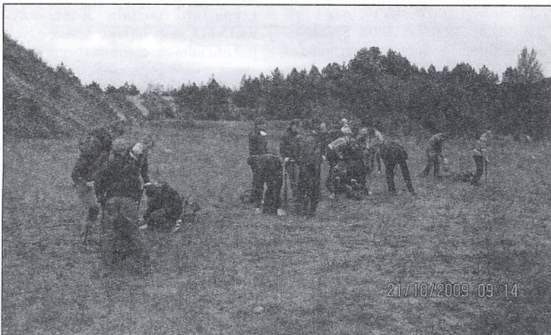
Uczniowie gimnazjum z Zespołu Szkół w Wielkim Podlesiu podczas sadzenia drzewek sosny zwyczajnej.