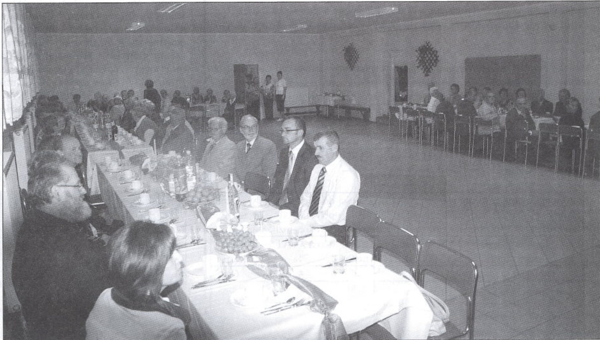
Jednym z naliczniejszych spotkań z Seniorami jest spotkanie w Wielkim Klinczu.