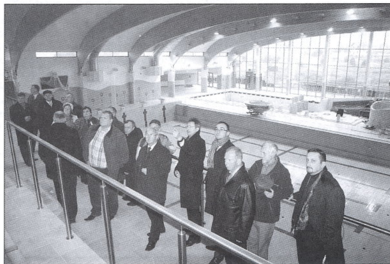
Radni Gminy Kościerzyna byli pod dużym wrażeniem zaawansowania i wykonania prac na kościerskim basenie

nych w naszym powiecie inwestycji, czyli basenu. Radni mieli okazję zobaczyć inwestycję od podszewki, gdzie trwają prace wykończeniowe przed planowanym na drugą dekadę grudnia oficjalnym otwarciem tej wielkiej inwestycji. Prace wykończeniowe są bardzo zaawansowane i mają się ku końcowi, jak i również wyposażanie pomieszczeń w sprzęt sportowy i meble. Można jedynie pogratulować inwestorom i cieszyć się, że już wkrótce i na naszym terenie będziemy mieli basen z prawdziwego zdarzenia.