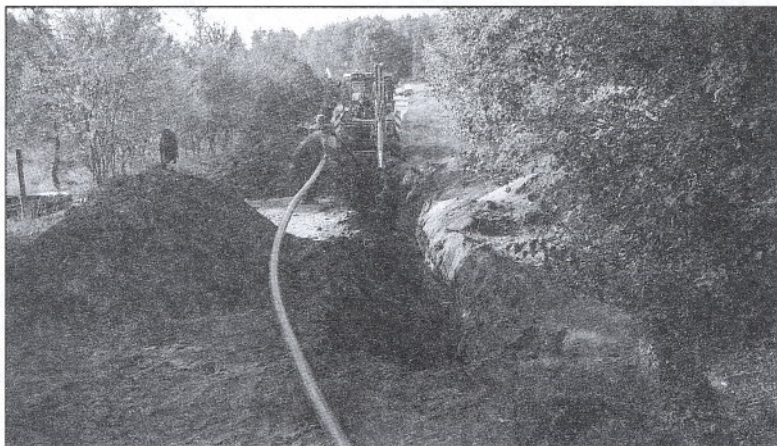
Brygada wodociągowa Zakładu Komunalnego przy budowie wodociągu Grzybów-Grzybowski Młyn