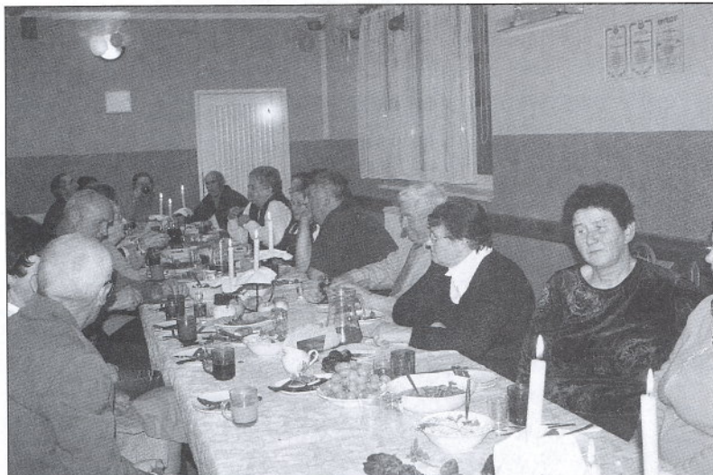
Bardzo miła atmosfera była podczas spotkania z seniorami w Kłobuczynie.