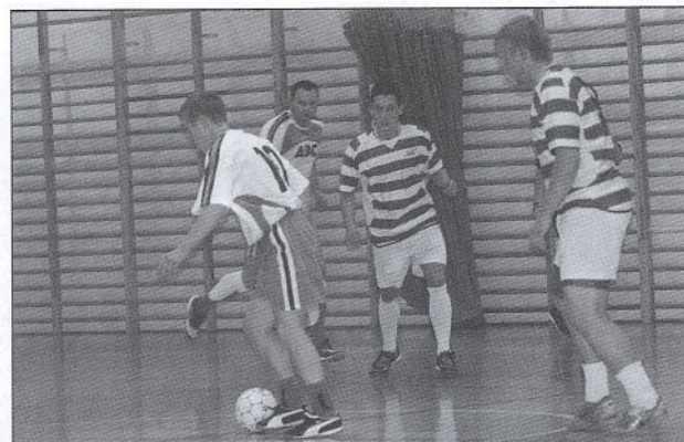
Drużyna Ceramika Łubiana po bardzo zaciętym meczu wygrała swój mecz 3:2

śledzić na stronie internetowej http://www.halowka.koscierzyna.info portalu Kościerzyna.INFO, który od tegorocznej edycji jest oficjalnym serwisem rozgrywek. /red/