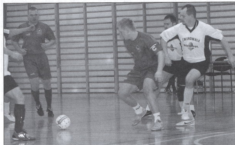
Zawodnicy DECH-POLU Grzybowo nie sprościli drużynie strażaków z Kościerzyny i przegrali swój mecz aż 1:7

śledzić na stronie internetowej http://www.halowka.koscierzyna.info portalu Kościerzyna.INFO, który od tegorocznej edycji jest oficjalnym serwisem rozgrywek. /red/