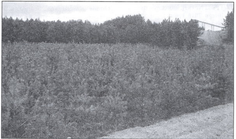
Tak wygląda 5-cio letnia uprawa na jednym z terenów po byłej żwirowni