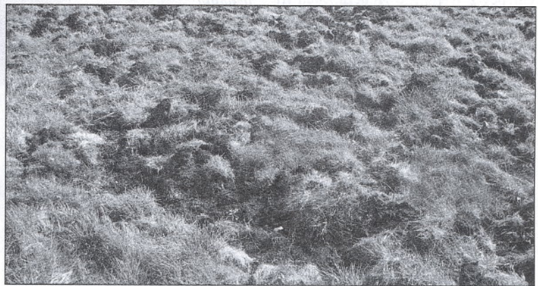
Przykładowe szkody łowieckie wyrządzone przez zwierzęta łowne.