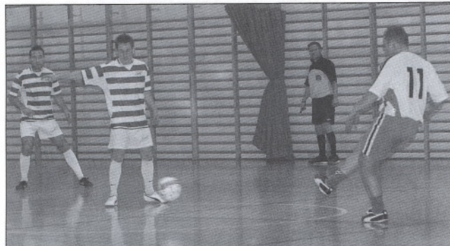
Wszystkie mecze 1 kolejki były bardzo zacięte i wzbudzały wiele emocji wśród kibiców.

W PHLPN uczestniczy ok. 500 zawodników z powiatu Kościerskiego i Kartuskiego, którzy rozegrają ponad 220 spotkań. Spotkania piłkarskie będą się odbywać na halach w Sokolni i Skorzewie: w soboty 2 liga od godziny 14:30 do 20:30 i w niedziele 3 liga od godziny 10:00 do 15:30, oraz 1 liga od godziny 16:30 do 20:00. Szczegółowe informacje dotyczące terminarza oraz wyników meczy można na bieżąco