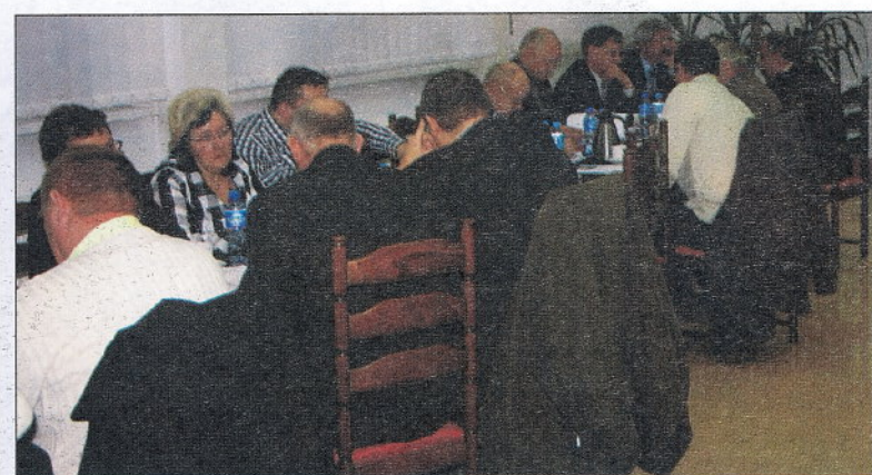
Ostatnia sesja Rady Gminy Kościerzyna była bardzo pracowita dla radnych, którzy podjęli kilka bardzo ważnych uchwał.

Gminny Ośrodek Pomocy Społecznej w Kościerzynie . Bardzo ważną decyzją dla dużej ilości mieszkańców gminy, było zatwierdzenie potrzeb gminy w zakresie wykonywania prac społecznie-użytecznych w 2010 roku. Gmina określiła liczbę bezrobotnych, których chce kierować do tych prac na ok. stu . Łączna liczba godzin do wykonania tych prac określona została na 19,500 . Rada podjęła również decyzję o przystąpieniu do Stowarzyszenia Lokalna grupa Rybacka „Mòrénka” . /w/