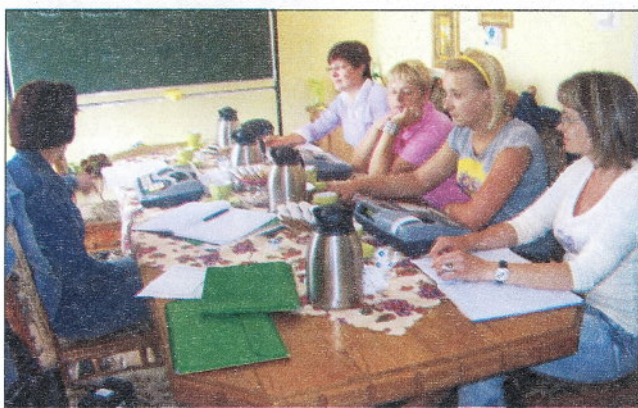
Uczestniczki projektu podczas jednego z kursów.