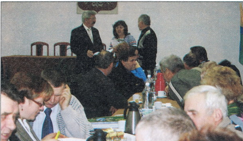
Wójt zapoznał sołtysów z zamierzeniami inwestycyjnymi gminy zaplanowanymi do realizacji w 2010 r.