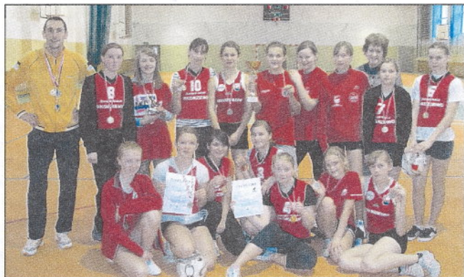
Zwycięska drużyna reprezentantek ze Skorzewa