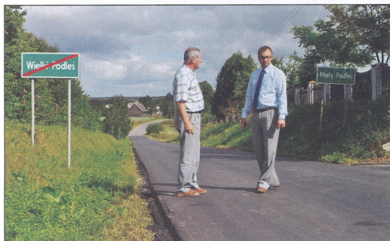
Nowy dywanik asfaltowy w Wielkim Podlesiu.

kano się z przedstawicielami parlamentu RP, ministrami, marszałkami i przedstawicielami innych instytucji w sprawach związanych z rozwojem naszej gminy. W zakresie gospodarki gruntami przyjęto za rentę planistyczną drogę o pow. 750 m 2 w W. Klinczu, zbyto 2 działki o pow. łącznej 2083 m 2 za 53.682 zł, sprzedano 1/13 udziału w prawie użytkowania wieczystego dz. 420 m 2 za 10450 zł i przekształcono p.u. wieczystego w prawo własności dla dwóch działek o łącznej pow. 1972 m 2 za 3.129 zł. Dochody naszego budżetu za I półrocze zostały zrealizowane w 51,91% tj. 21.270,719 zł (dochody z udziałów CIT i PIT są zagrożone). Wydatki zrealizowano w 40,7% tj. 22.952,916 zł co wynika z faktu iż płatności realizowanych inwestycji przypadają w II półroczu.