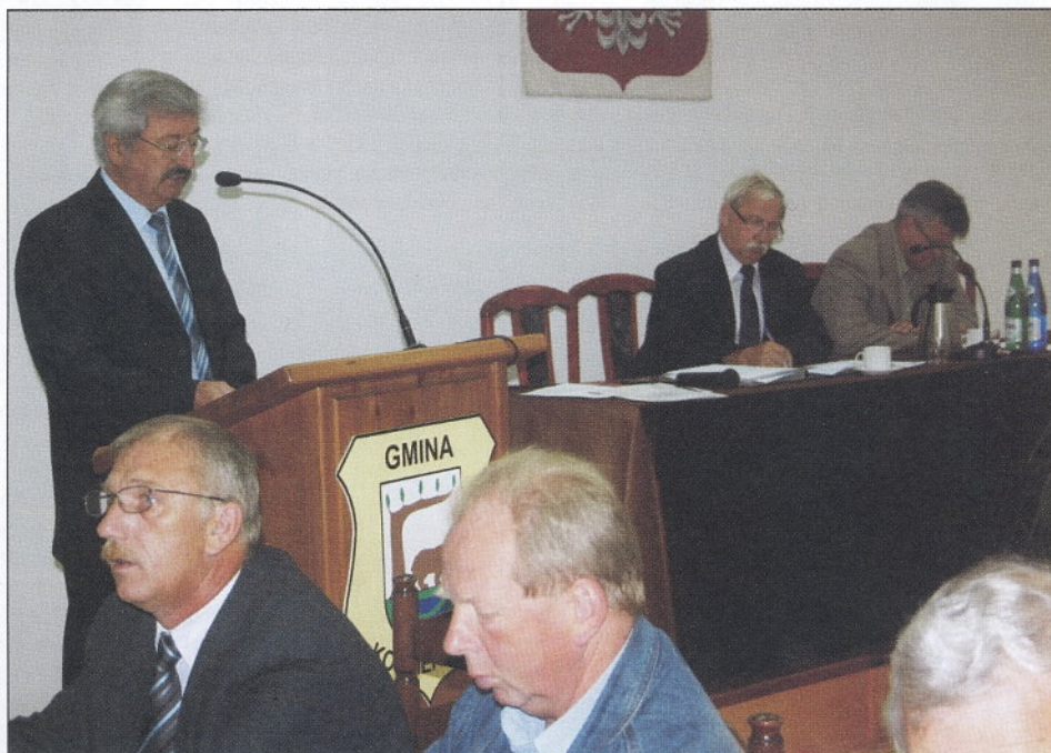
Wójt składa sprawozdanie z realizacji budżetu gminy za I półrocze 2010 r.