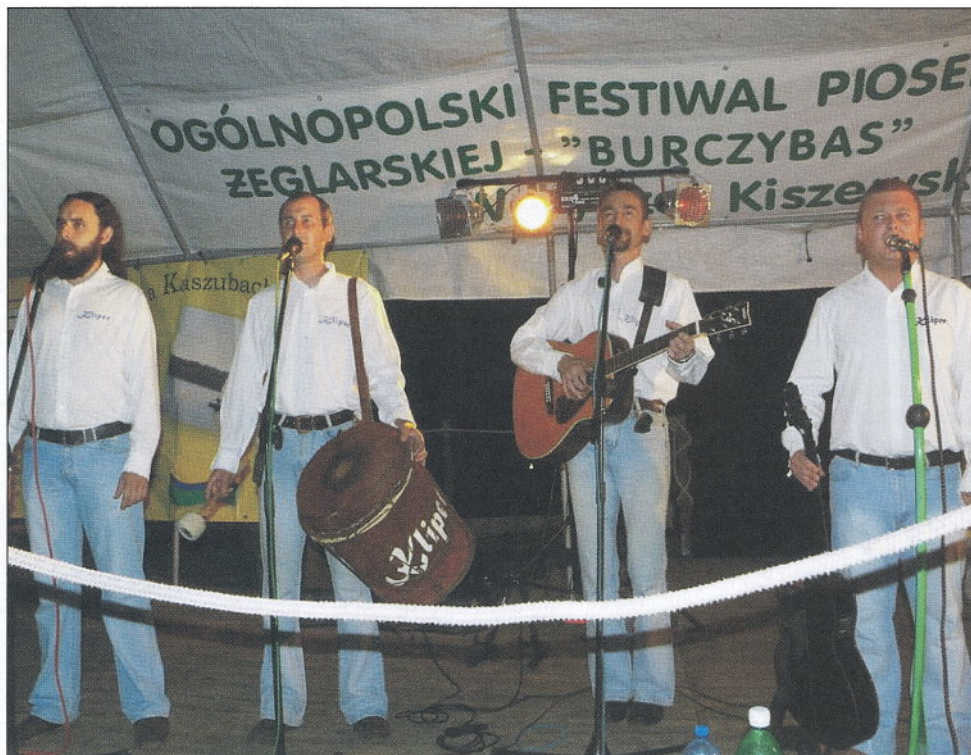
Podczas festiwalu zaśpiewał między innymi zespół Kliper.