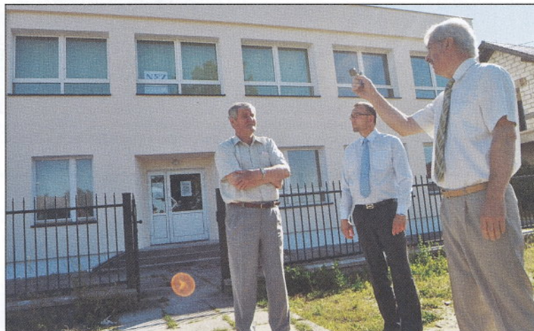
Budynki komunalny w Wąglikowicach po wykonanym remoncie zewnętrznym.

udział projektowany jest na poziomie 200 tys. zł. Z programu PROW 4.1 przyznano nam środki na projekt pn. „Rewitalizacja zapomnianych cmentarzy w Gminie Kościerzyna”. Projekt obejmuje 15 cmentarzy (Kłobuczyno, Kaliska, W. Klincz, Zielonin, Będomek, N. Klincz, N. Wieś, Dobrogoszcz, Dąbrówka, Grzybowski Młyn, Niedamowo, W. Podles, M. Podles, Puc). Z funduszu dróg śródpolnych otrzymaliśmy dotację w wysokości 80 tys. zł. W zakresie spraw organizacyjnych należy wspomnieć o corocznych zebraniach wiejskich, spotkaniach z sołtysami. Doprowadzono do założenia 6 Społecznych Komitetów budowy kanalizacji. Zorganizowano spotkanie Gminnej Rady KGW, spotkano się z przedstawicielami Związku Emerytów i Rencistów, z przedstawicielami ZHP omawiano problemy dotyczące zwiększenia obszaru działania. Przeprowadzono wybory Prezydenta RP na terenie naszej gminy, a obecnie przygotowujemy się do przeprowadzenia w terminie 1.IX – 31.X. Powszechnego Spisu Rolnego. Spoty-