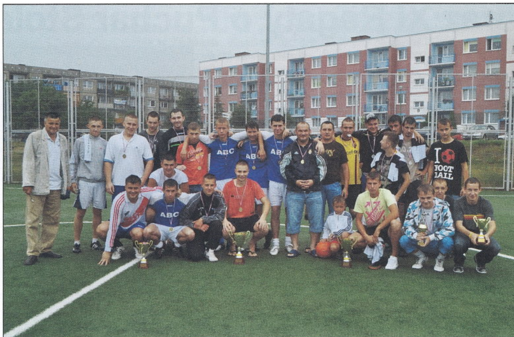
Wspólne zdjęcie uczestników Grand Prix "6" piłkarskich o Puchar Wójta Gminy Kościerzyna