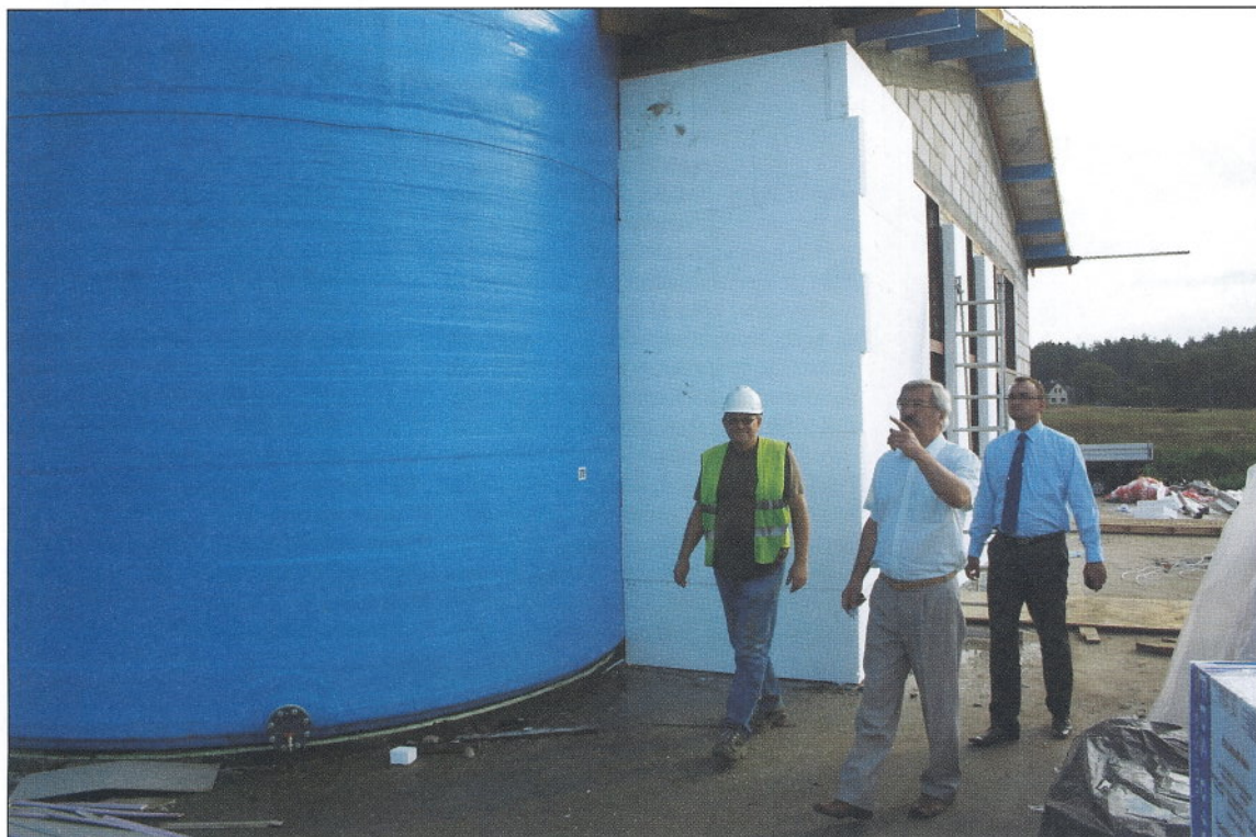
Kolejna z wielkich inwestycji prowadzona przez Gminę Kościerzyna. Rozbudowa i modernizacja Oczyszczalni Ścieków w Wielkim Klinczu, która polega na zwiększeniu przepustowości oczyszczalni z 250m 3 /d do 660m 3 /d a jej koszt wyniesie 7 300 000 zł.