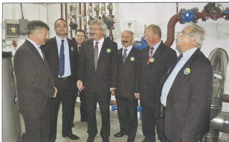
Goście byli pod wrażeniem zmian, które nastąpiły po termomodernizacji.