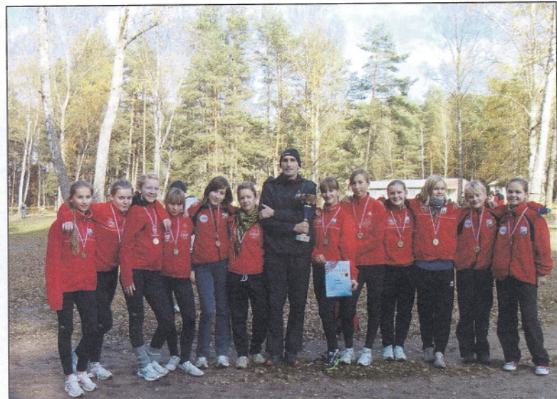
Dziewczęta reprezentacja gimnazjum ze Skorzewa zajął drugie miejsce na zawodach wojewódzkich w Garczynie.