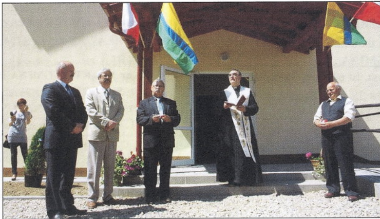
Ośrodek Kultury i Edukacji w Nowym Klinczu.

wykonano piłko chwyty i niezbędne ogrodzenia. Dla ożywienia życia społeczno-kulturalnego wybudowano Ośrodek Kultury i Edukacji w Nowym Klinczu za 600.000 zł. Jest to obiekt służący za bazę zespołu folklorystycznego „Kaszubskie Nuty” i KGW Wielki Klincz. Przeprowadzono remonty na 9 salach wiejskich tj. Częstkowo, Wdzydze, Rotembark, Wielki Klincz, Nowy Klincz, Będomek, Kłobuczyno, Stawiska, Kaliska. Wykonano kapitalny remont budynku Sali wiejskiej w Nowej Wsi (80.000 zł.); remont punktu medycznego i elewacji budynku komunalnego w Wąglikowicach, zaadaptowano pomieszczenia na salę wiejską w Niedamowie, zmodernizowano i wyposażono „Obozowisko Garczyn”. Przeprowadzono szereg remontów w naszych placówkach oświatowych przeznaczając na ten cel ok. 2.600.000 zł. największym zadaniem była termomodernizacja szkoły w Lubianie, połączona z wymianą pokryć