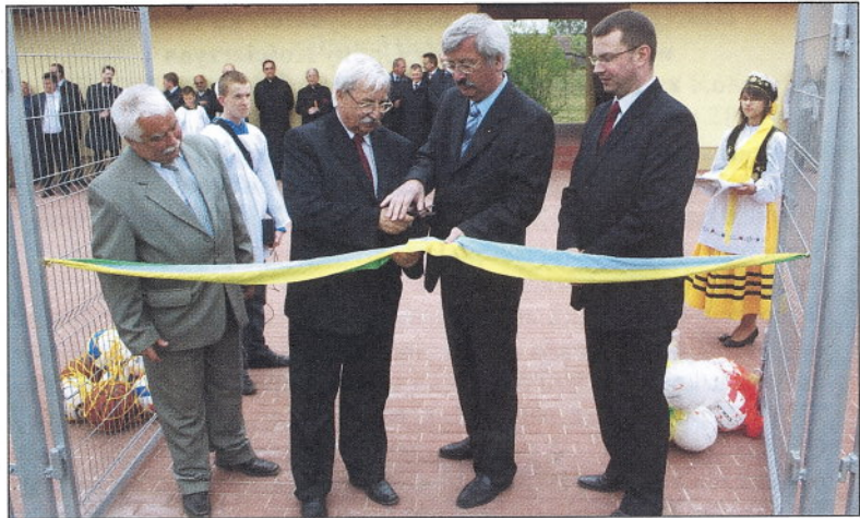
Bardzo udaną inwestycją był „Orlik” w Lubianie.

przeznaczaliśmy w sumie 11.500.000 zł. W zakresie inwestycji sportowych kosztem 1.100.000 zł. zbudowano kompleks boisk „Orlik” z zapleczem w Lubianie. W Centrum Sportu w Skorzewie zmodernizowano nawierzchnię podłogi w hali, ocieplono budynek, rozbudowano zaplecze, wybudowano nowe boisko do piłki nożnej z trybunami i 100 mb bieżni tartanowej. Łączny koszt to 3.600.000 zł. W Wielkim Klinczu trwa budowa hali sportowej o wymiarach 61,5 x 33 mb z widownią na 200 miejsc i parkingiem – 5.700.000 zł. W Lubianie na potrzeby Sekcji Podnoszenia Ciężarów zaadaptowano i wyposażono pomieszczenie po szkolnej kotłowni; zniwelowano teren pod boisko treningowe dla „Ceramika”; w Skorzewie wyremontowano i doprowadzono wodę do szatni przy boisku treningowym; na boiskach w Niedamowie, Wąglikowicach, Nowym Klinczu, Wielkim Podlesiu