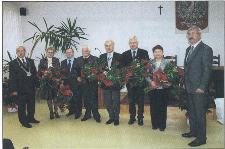
Wójt i Przewodniczący wraz z uchenonorowanymi „Złotym Laurem”.