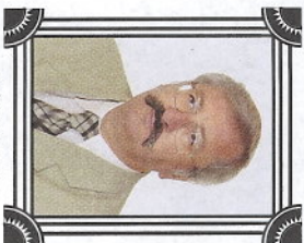
WÓJT GMINY Waldemar Tkaczyk