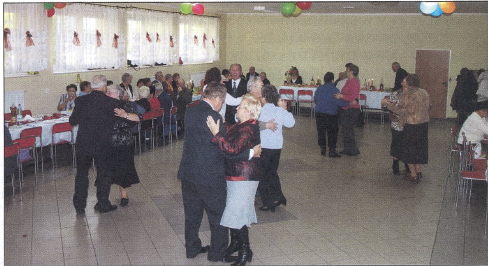
Dla uczestników przewidziano wiele atrakcji i zabaw.

Wiejskich lub najbardziej aktywne Panie z sołectwa. Zawsze na spotkaniach z seniorami są przedstawiciele Urzędu Gminy Kościerzyna , panie z Gminnego Ośrodka Pomocy Społecznej , które często są współorganizatorami uroczystości oraz radni. W organizację spotkań włączają się najczęściej Sołtysi, radni i Rady Sołeckie . Największe spotkania mają już od lat miejsce w Wielkim Klinczu ,