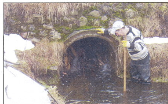
Całkowicie zapchany przepust pod drogą, to przykład działania bobrów na naszym terenie.

do przepustów krat. Będziemy obserwować na bieżąco, na ile ten zabieg okaże się skuteczny. /red/