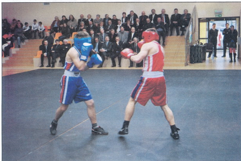
... i sekcja bokserska.