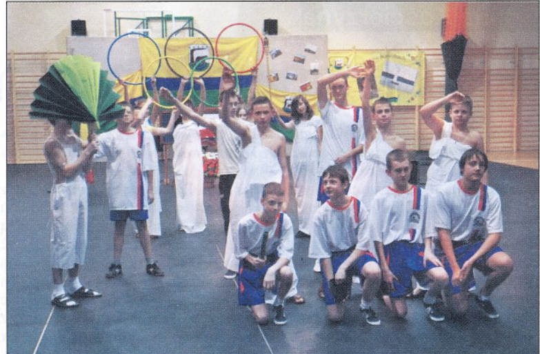
... oraz uczniowie z Zespołu Kształcenia w Wielkim Klinczu.