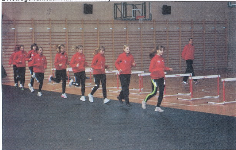
Zaprezentowały się również sekcje sportowe, takie jak: lekkoatletyka...