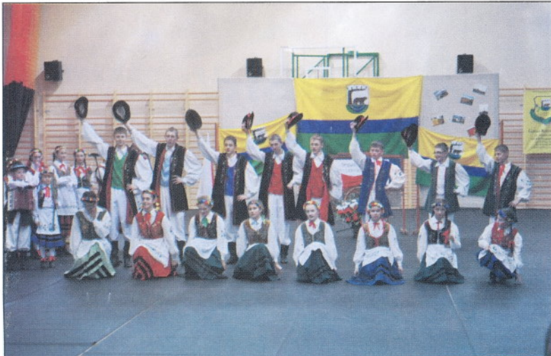
Podczas otwarcia hali program artystyczny przedstawił zespół folklorystyczny z Nowego Klincza "Kaszubskie Nuty"...