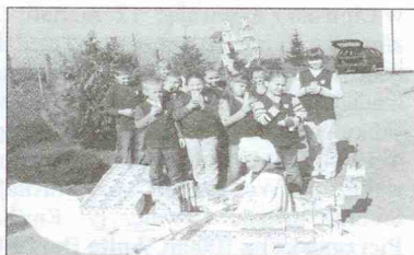
Łódka w wykonaniu klasy III