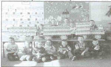
Pociąg wykonały dzieci z "0"