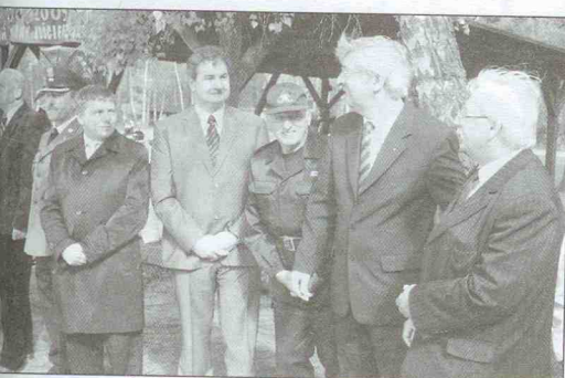
Goście na otwarciu VIII Pikniku Strażackiego gminnych OSP.

W drugą sobotę maja w Powiatowym Centrum Młodzieży w Garczynie odbył się VIII Piknik Strażacki Gminy Kościerzyna . Do PCM w Garczynie przybyli druhowie wszystkich jednostek Ochotniczych Straży Pożarnej typu „S” ze Skorzewa, Łubiany, Wielkiego Klincza, Kłobuczyna, Obrogoszczy, Kalisk, Wąglikowice, Ornego, Wdzydz oraz jednostka typu „M” z Gostomia .