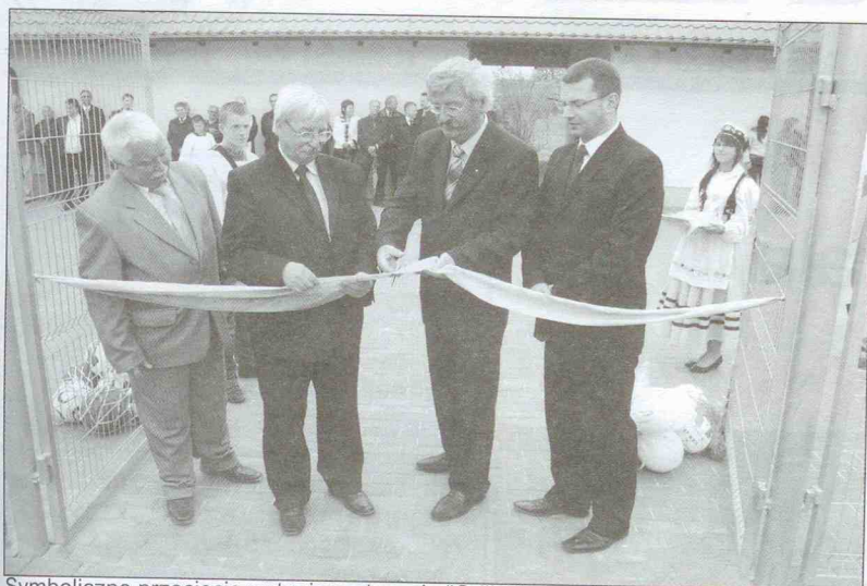
Symboliczne przecięcie wstęgi na otwarciu "Orlika".