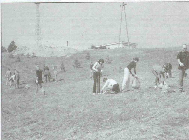
Pracownicy Urzędu Gminy podczas sadzenia lasu

W dniu 17 kwietnia 2009 roku radni Gminy Kościerzyna oraz pracownicy Urzędu Gminy Kościerzyna po raz kolejny sadzili las na starym wyrobisku górnictwem w miejscowości Grzybowo .