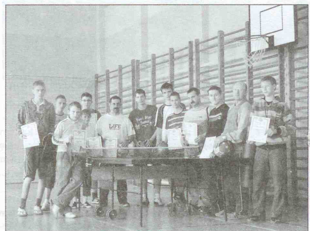
Uczestnicy turnieju w Łubianie