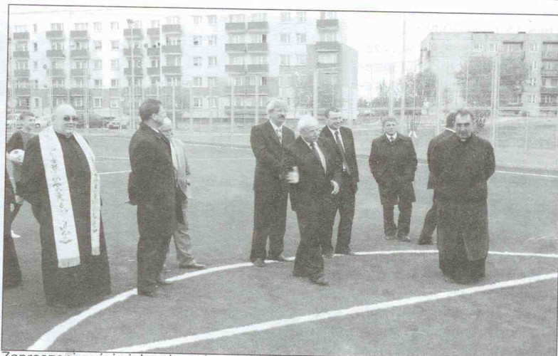
Zaproszeni goście jako pierwsi sprawdzili jakość nawierzchni boiska do piłki nożnej