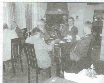
Pojedynki brydżystów były bardzo zacięte