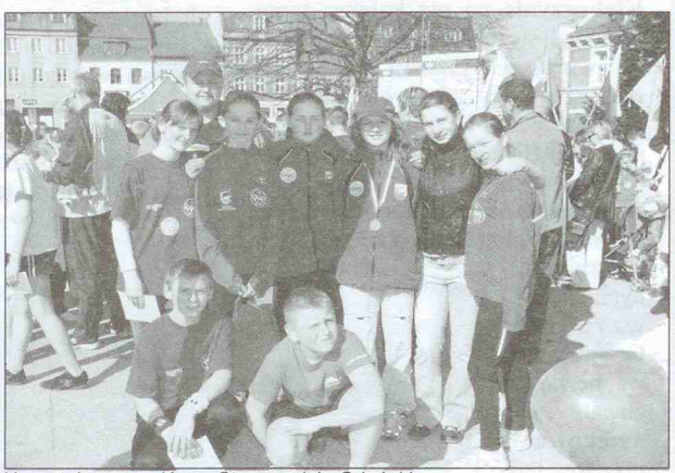
Uczestnicy zawodów w Starogardzie Gdańskim