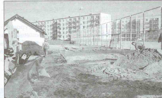
Brygada ZKKGK układa polbruk przy budynku ORLIKA

Od początku kwietnia br. rozpoczęto prace związane z niwelacją dróg gminnych gruntowych przy użyciu równiarki i walca ogumionego. W miejscach gdzie drogi były najbardziej zniszczone wysypiano ponad 70 ton tłucznia kamiennego. W związku z licznymi ubytkami w nawierzchniach asfaltowych brygada drogowa Zakładu Komunalnego, na bieżąco uzupełnia je tzw. „zimną masą”. Tylko w tym roku zostało już wbudowane ponad 10 ton tej masy. Z drugiej jednak strony natężenie ruchu, szczególnie ciężkich zestawów samochodowych, powoduje że powstają kolejne ubytki, które trzeba dodatkowo uzupełniać. Dla utrzymania bezpieczeństwa ruchu, zlecono firmie PUDM Kościerzyna wymianę najbardziej zni-