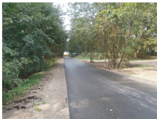
Droga w Grzybowskiem Młynie