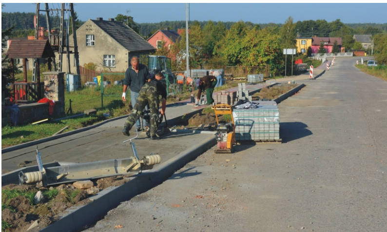
Budowa chodnika w Stawiskach

Trwa budowa chodników w Stawiskach, Sycowej Hucie i w Łubianie przy ul. Słonecznej.