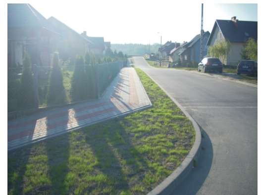
Skorzewo ul. Kasztanowa