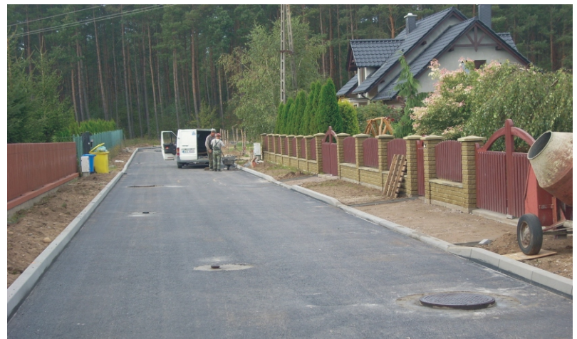
Remont ulicy Miodowej w Łubianie