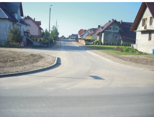
Ulica Majkowskiego w Wielkim Klinczu