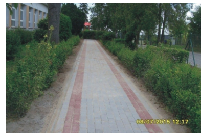
Nowy chodnik przy Szkole Podstawowej w Nowym Klinczu