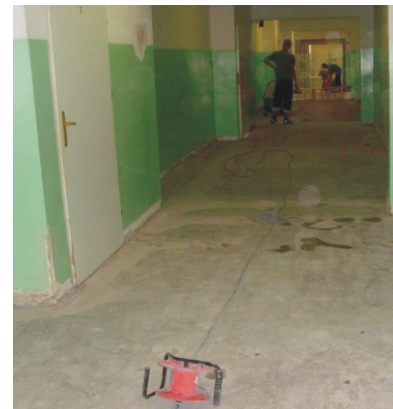
Wymiana wykładziny na korytarzu w Zespole Kształcenia w Wielkim Klinczu