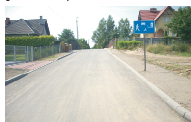
Nowy asfalt w Dębogórach

1) Niedamowo - ułożenie płyt YOMB na drodze gminnej w rejonie skrzyżowania z drogą powiatową