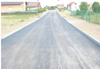
Nowy asfalt w Łubianie ul. Spacerowa