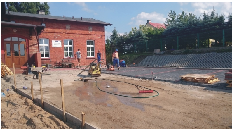
Porządkowanie placu przed budynkiem Szkoły Podstawowej w Kornem