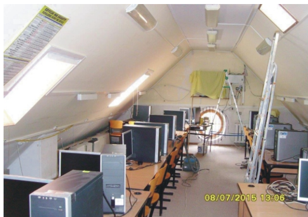
Remont sali komputerowej w Zespole Szkół w Wielkim Podlesiu