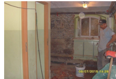
Remont toalet w budynku Szkoły Podstawowej w Skorzewie