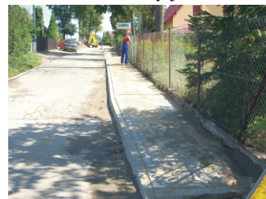
Budowa chodnika w W. Podlesiu

Na zadania inwestycyjne zabezpieczono kwotę 4.684.310 zł. Część robót wykonywana jest przez ekipę Zakładu Komunalnego Gminy Kościerzyna. Aktualnie układany jest chodnik