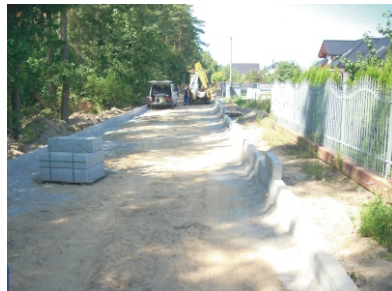
Budowa drogi w Małym Klinczu ul. Leśna

asfalt na ul. Ogrodniczej - koszt 284.990 zł