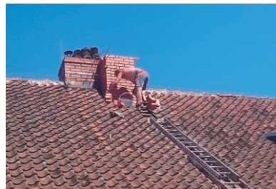
Remont komina w Szkole Podstawowej w Kłobuczynie