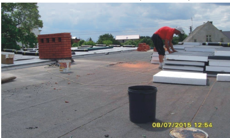
Remont dachu na pawilonie szkolnym w Szkole Podstawowej w Niedamowie