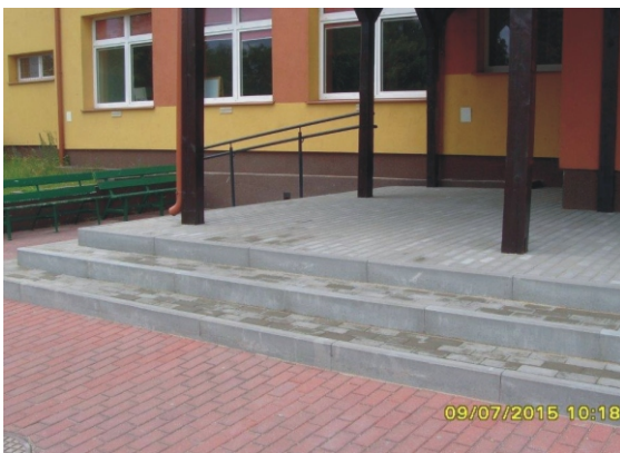
Nowe wejście do Zespołu Kształcenia w Łubianie