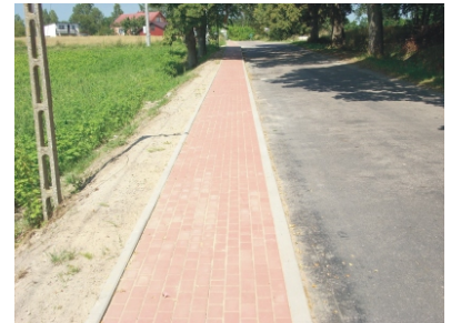
Nowy chodnik w Stawiskach

2) Nowy Podleś - płyty YOMB na podjeździe na wiadukt kolejowy