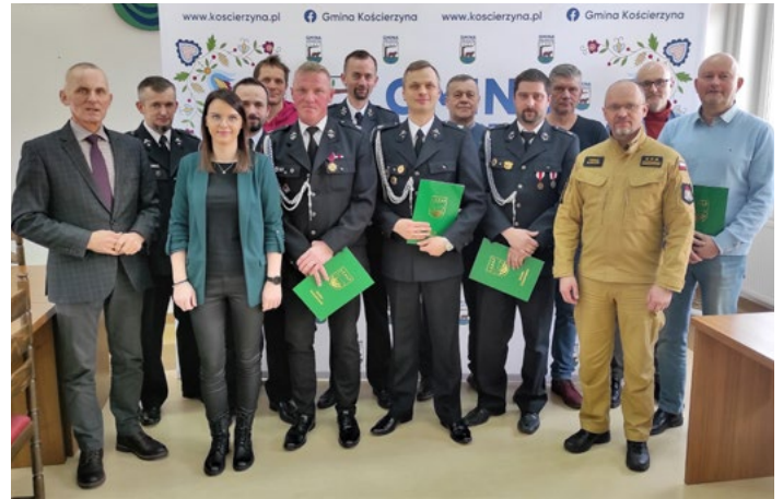
dem, Dobrogoszczy, Osadzie Burego Misia i Gostomiu. Red.

utrzymania jednostek w pełnej gotowości operacyjnej. Spotkanie było również okazją do podsumowania dotychczasowych działań druhow na rzecz lokalnych społeczności oraz omówienia bieżących potrzeb sprzętowych. Do Urzędu Gminy przybyli reprezentanci jednostek OSP w: Łubianie, Wielkim Kłinczu, Skorzewie, Kłobuczynie, Kaliskach Kościerskich, Kor-