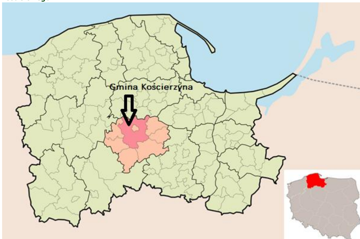
Rysunek 1 Położenie Gminy Kościerzyna na mapie województwa pomorskiego i powiatu kościerskiego